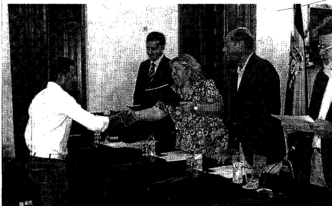
La consejera entregó ayer resoluciones de ayudas a empresas almerienses para la mejora de calidad y tecnología. R.G.

El nuevo master sobre agricultura potenciará el desarrollo de productos de IV, V y VI gama, de más valor añadido