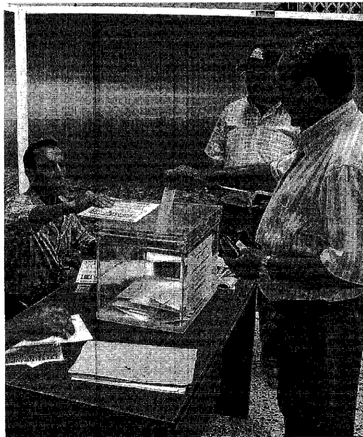
Los regantes dispusieron de cinco puntos para votar.