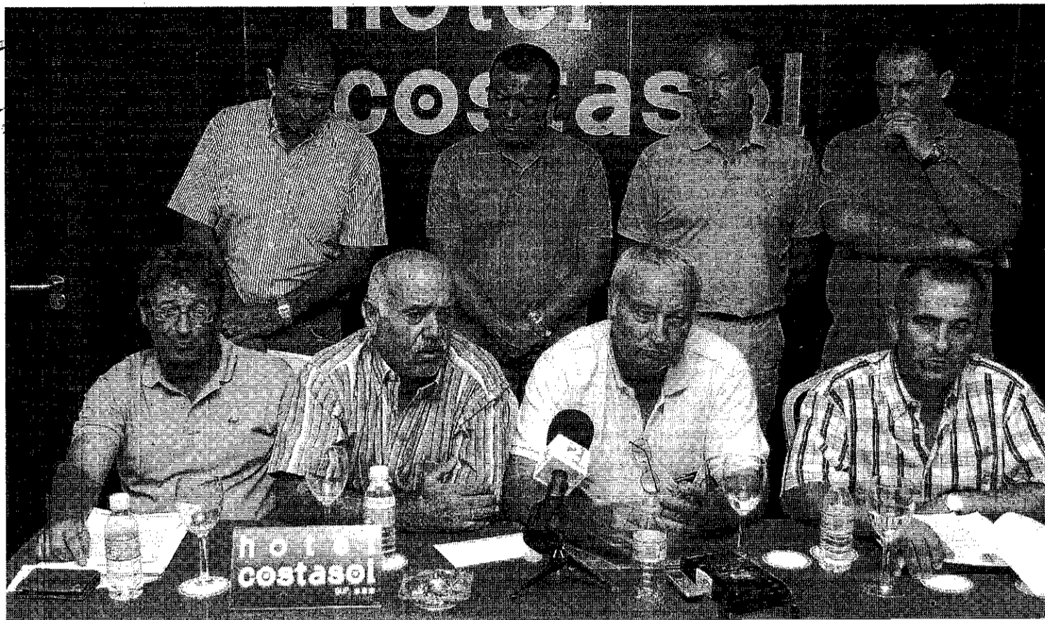
Regantes de Sol y Arena denuncian la opacidad con la que se han convocado los comicios celebrados ayer.

Se siente sorprendido por las reacciones de algunos comuneros aunque, en general, la jornada ha sido tranquila