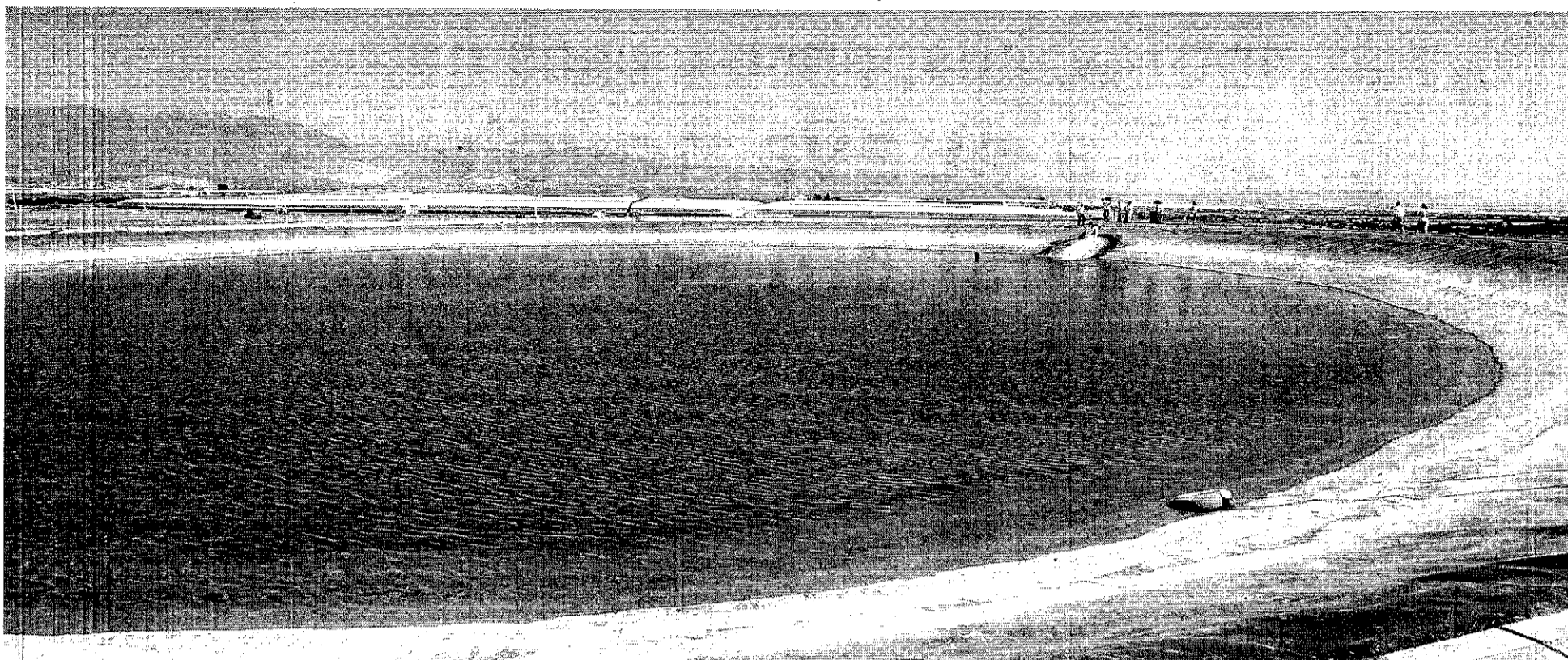
Los representantes de la principal asociación de regantes andaluza están en pie de guerra por cómo se está aplicando la Ley de Aguas por parte de la Junta de Andalucía.